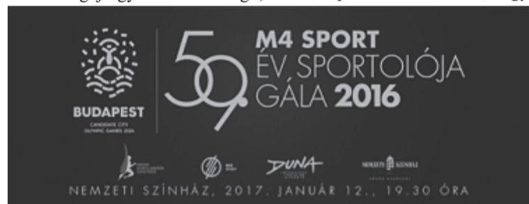
A gála logója