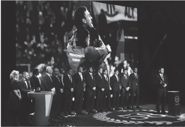
A képen a magyar labdarúgó-válogatott, amelyet tavaly az Eb-kijutásnak köszönhetően díjaztak

„Mindenki összefogott, aki a magyar sportban számít. Az idei gála a 2024-es olimpiai pályázat ügyének alárendelve zajlik, mindenki kötelességének érzi a részvételt, és ez nagyon jó érzés, hiszen közös vagyunk az olimpia megrendezése” – fejtette ki Szöllősi György. Elmondta, külföldről díjátadónak érkeznek többek között Novák Károly Eduárd csúszeredai paralimpiai bajnok, Claude Makelele világbajnoki ezüstérmes, Bajnokok Ligája-győztes labdarúgó,