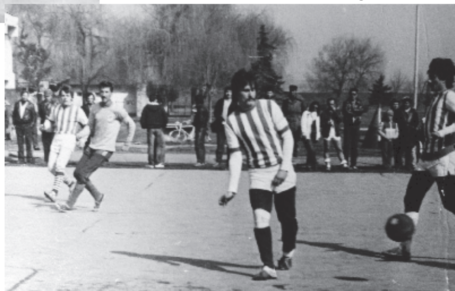
Mindig nagy volt az érdeklődés a vikendtelepi bajnokság iránt