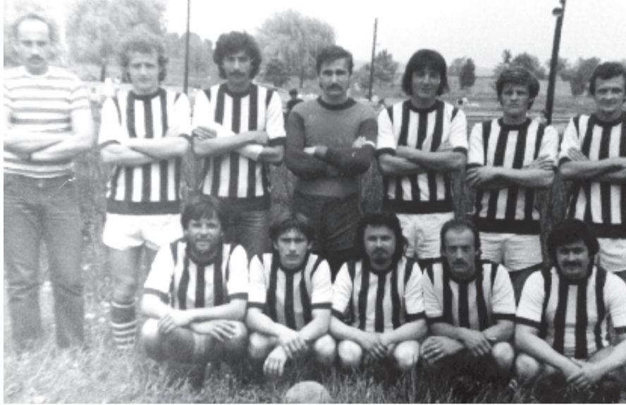
A csapat egykoron...

Az együttes 35 éves fennállására szervezett ünnepségen szólaltattuk meg néhány tagját, akik felidéztek az alakulat eredményeit, és közös emlékekről meséltek.