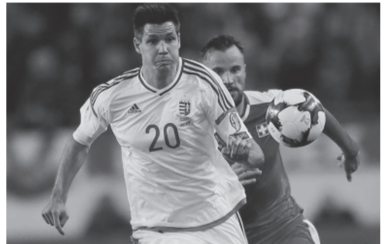
A magyar válogatott hátvéd számára azért is lesz sportszakmai szempontból előrelépés az új bajnokság, mert klasszis támadók ellen futbalozhat, véli a játékos menedzsere

A klub székhelye Kína egyik legkeletibb részén, az észak-koreai határtól mintegy negyven kilométerre fekvő Jencsi városában van.